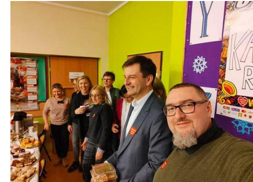
mat. graf. Organizatora Fot. Fb M. Śpiewok